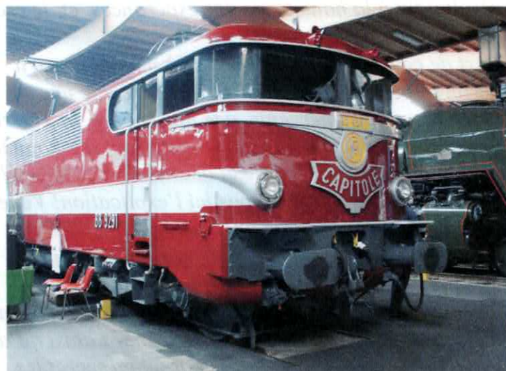
La 241 P 16 a qui sa petite sœur, la P 17 est venue dire bonjour ce 8 mai et la BB 9291, qui assurait les liaisons Paris / Toulouse du "Capitole".