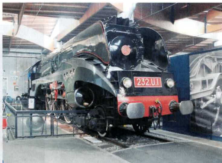
La PR 2, voiture des Présidents de la République française, le dernier utilisateur fut le Général De Gaulle avant que ses successeurs ne lui préfèrent l'avion et la 232 U 1, dernière locomotive à vapeur française