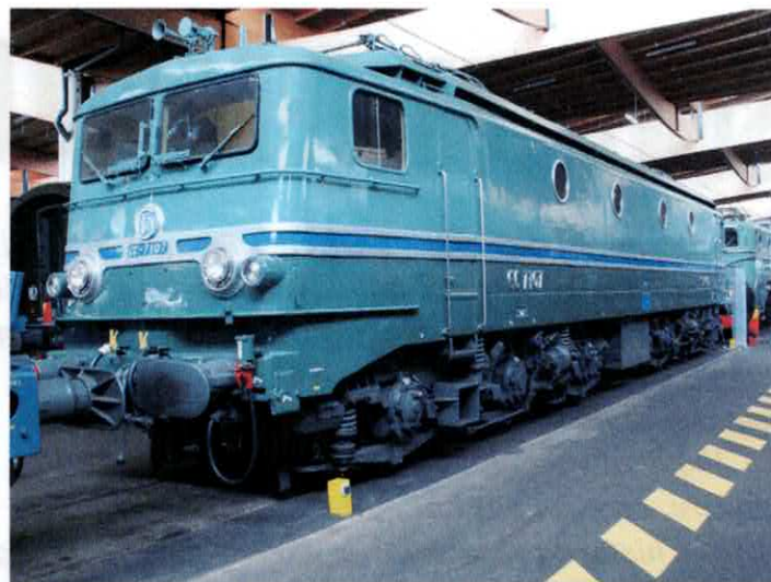
La BB 9004 et la CC 7107 toutes deux détentrices du record du monde vitesse sur rail le 28 et 29 Mars 1955 avec 331 km/h....