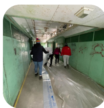
Mise en place des protections