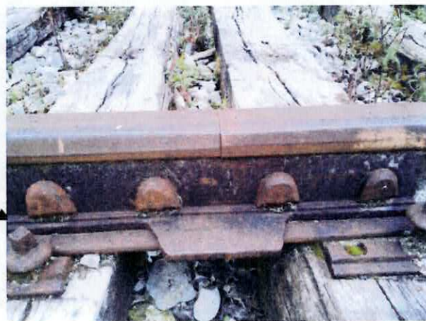
Joint « fermé »