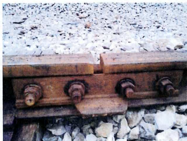
Joint « ouvert »